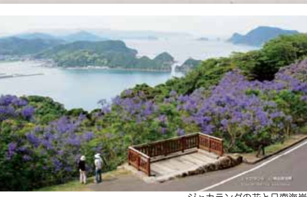
ジャカランタの花と日南海岸