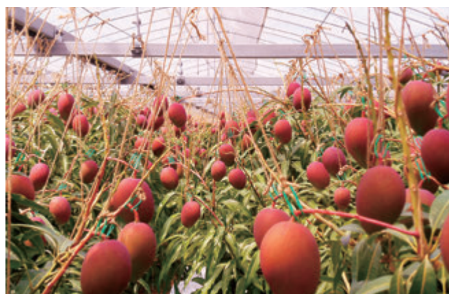
完熟前のマンゴー

2. 「金利リスクに関する事項」については、平成31年金融庁告示第3号（2019年2月18日）による改正を受け、2020年3月末から△NIIを開示することとなりました。