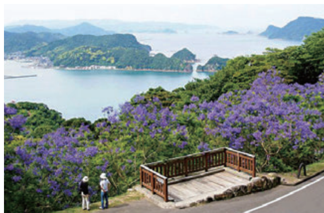
ジャカラングの花と日南海岸

当組合では、自己資本比率算定にあたり、投資損失引当金・偶発損失引当金を一般貸倒引当金あるいは個別貸倒引当金と同様のものとして取扱っておりますが、P.14の「一般貸倒引当金、個別貸倒引当金の期末残高及び期中の増減額」及び次頁の「業種別の個別貸倒引当金及び貸出金償却の残高等」には当該引当金の金額は含めておりません。