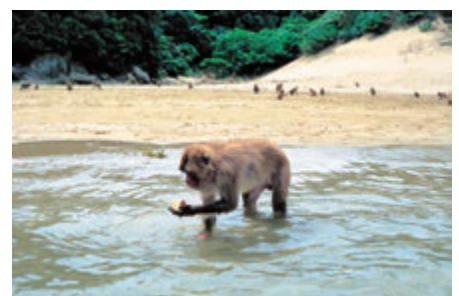
芋を洗う幸島の猿