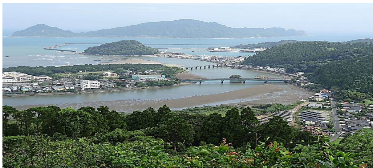
「南郷城跡より撮影」