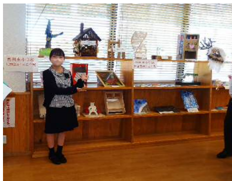
吾田東小学校生徒の夏休み作品展(9月1日~30日)